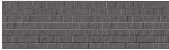
MFX894A ブランダMGダークグレー