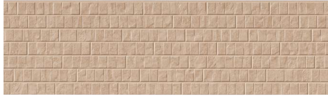
MFX893C ブランダMGキャメル