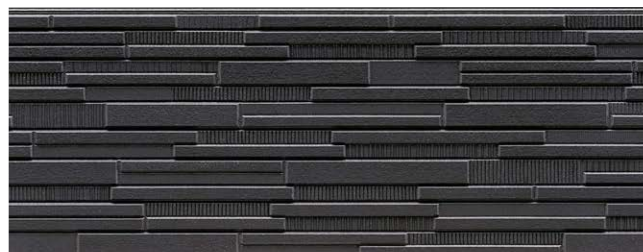
NH5854U ラスター チタン Mブラック