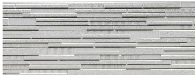
NH5852U ラスター チタン Sグレー