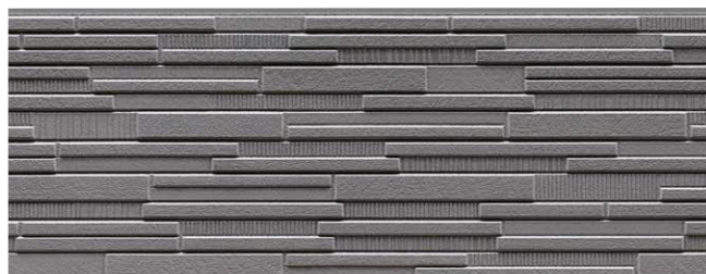
NH5853U ラスター チタン Dグレー