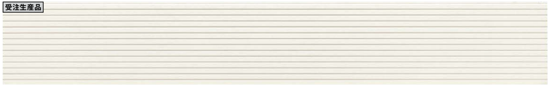
ユニットストライプ EH741*K