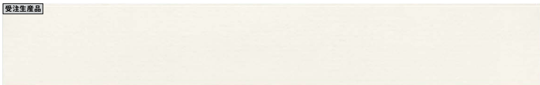
ユニットフラット EW742*K