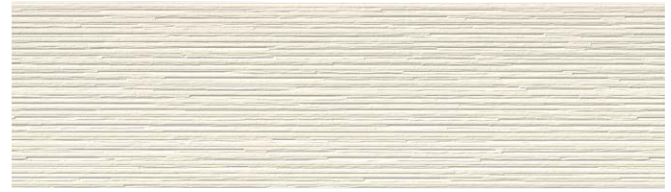
MFX722C エミネMGアイボリー