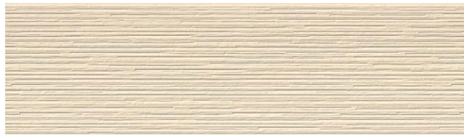
MFX723C エミネMGフレンチクリーム