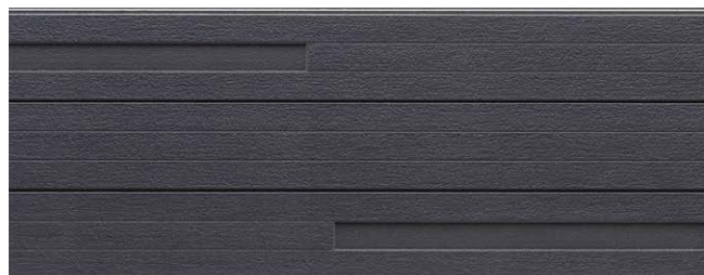
NH5863U QFテラ チタン ニアブラック