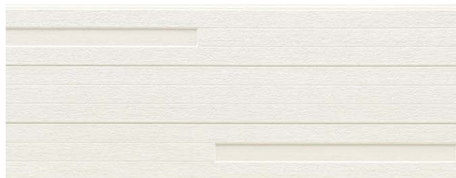
NH5861U QFテラ チタン ニアホワイト