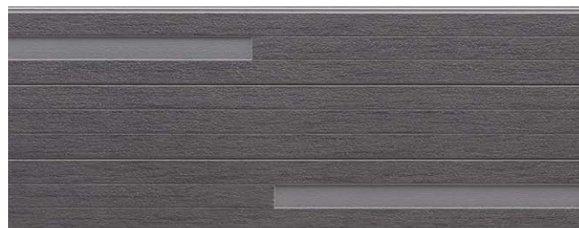
NH5864U QFテラ チタン ファーグレー