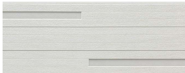
NH5862U QFテラ チタン ファーホワイト