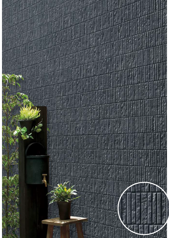
コルテMGブラックイメージ