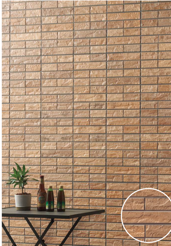
ソラニティーオレンジⅡイメージ