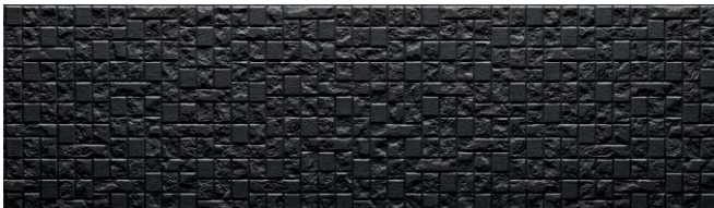
EPA138GK オリアンMGブラック