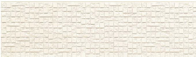
EPA136GK プリミアMGホワイト