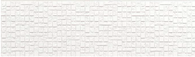
EPA135GK リベルMGクリアホワイト