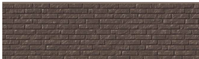
EL5514P アバダンMGダークブラウン30