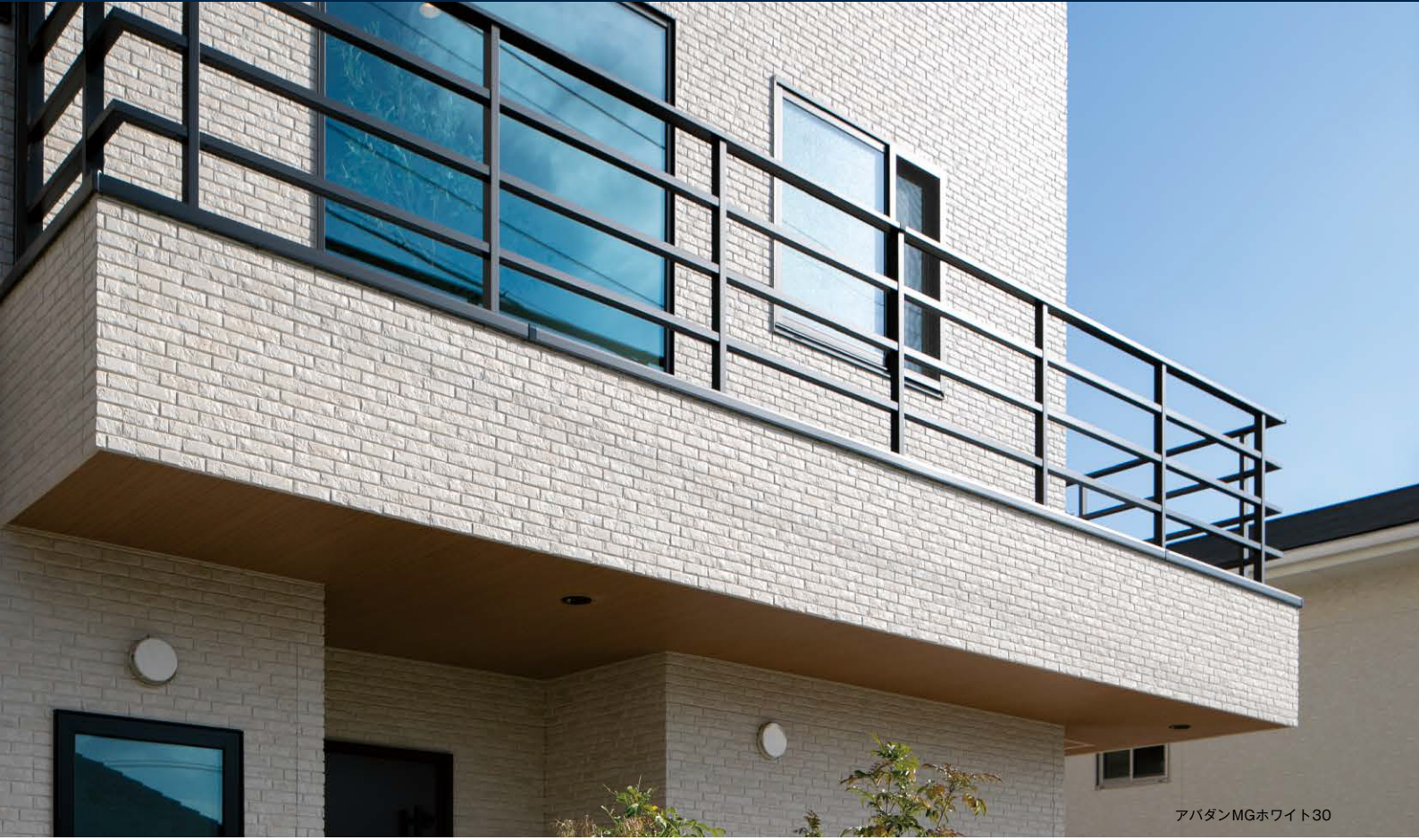
アバダンMGホワイト30