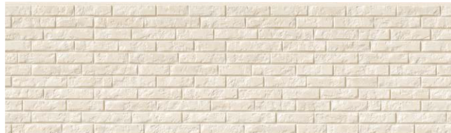
EL5511P アバダンMGホワイト30