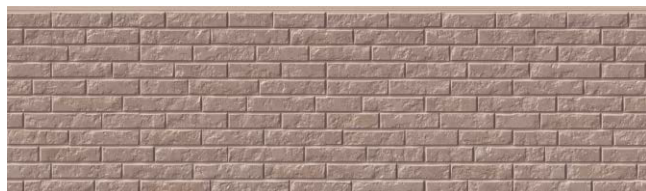
EL5513P アバダンMGエスプレッソ30