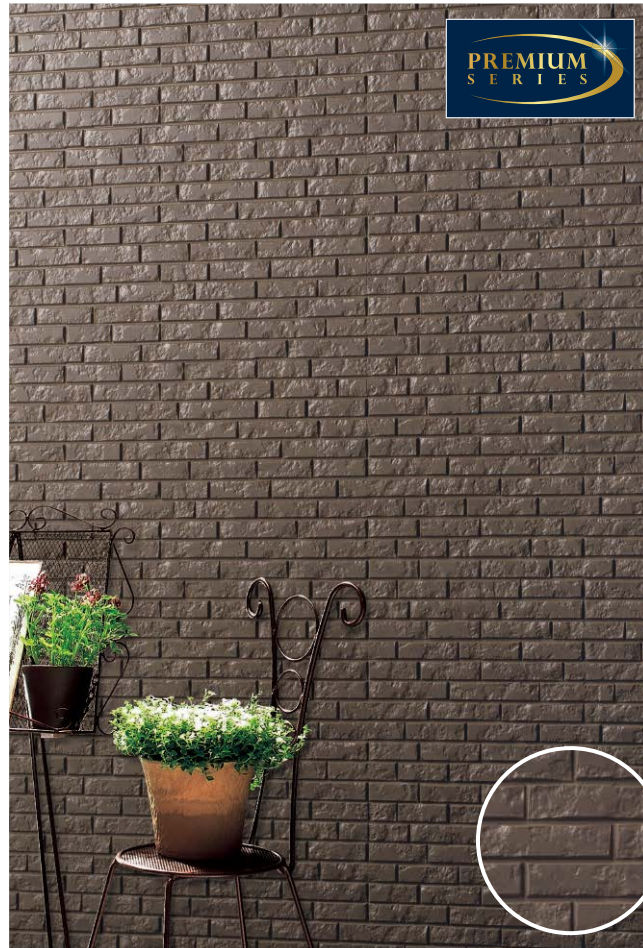
アバダンMGダークブラウン30イメージ