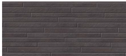
MF6910C エミュMGチャコール