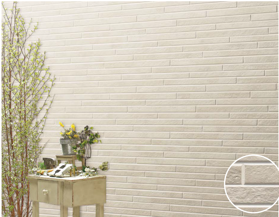
エミュMGベージュイメージ