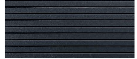
MDX2321A ゼスティブラックII (マイクロガードなし)