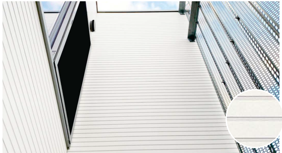
レモードMGホワイト