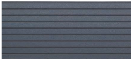
MDX2323A ゼスティネイビーII (マイクロガードなし)