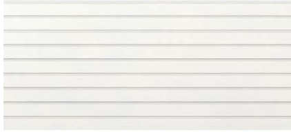
MFX231C レモードMGホワイト ※1