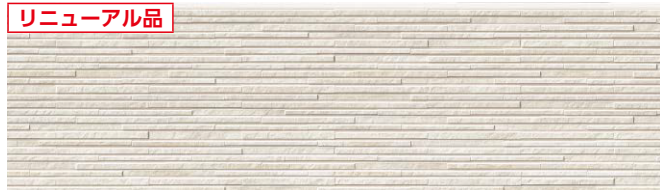
代表品番 EQS662 品番 EQS662D シュマルアイボリーⅡ