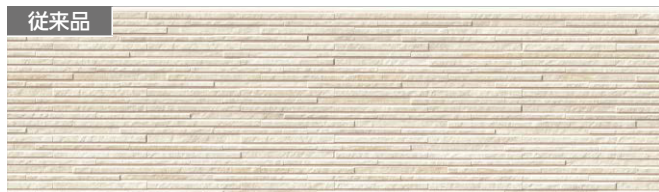
従来品 代表品番 EQS662 品番 EQS662E シュマールアイボリーE