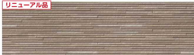
代表品番 EQS663 品番 EQS663D シュマルブラウンⅡ