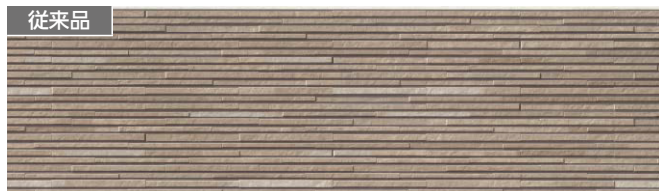
従来品 代表品番 EQS663 品番 EQS663E シュマールブラウンE