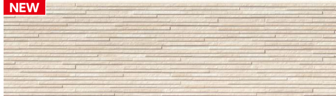
EQS661D シュマルベージュⅡ