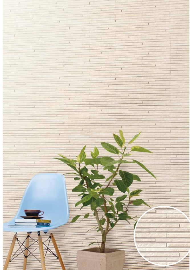
シュマルベージュⅡイメージ