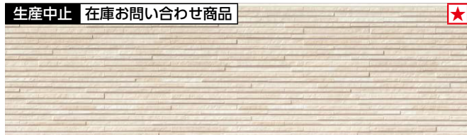
生産中止 在庫お問い合わせ商品 ★ EQS661E シュマールベージュE ※代替品は「EQS661D」になります。