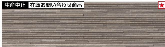
生産中止 在庫お問い合わせ商品 ★ EQS664E シュマールグレーE ※代替品は「EQS664D」になります。