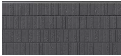
MFX855C セロMGグラファイト