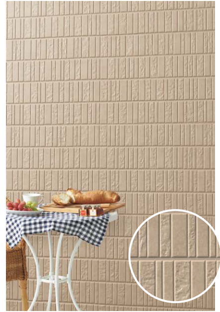
セロMGブラウンイメージ