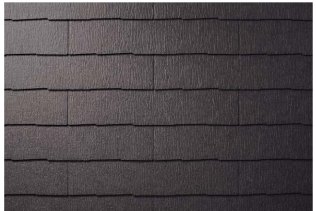
CC221K* ココナッツ・ブラウン (STK21KG)