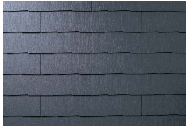
CC275K* パール・グレイ (STK75KG)