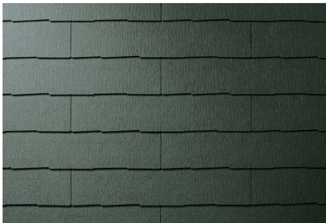
CC277K* ウェザー・グリーン (STK77KG)