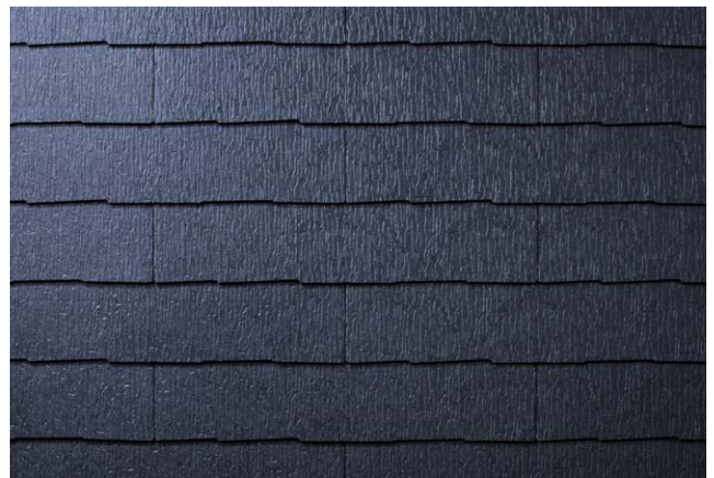
CC226K* ミッドナイト・ブルー (STK62KG)