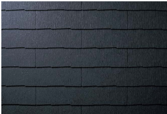
CC262K* ネオ・ブラック (STK62KG)

■カラーバリエーション 屋根材本体色に対応(推奨)する役物色は P120「役物推奨色対応表」をご確認ください。