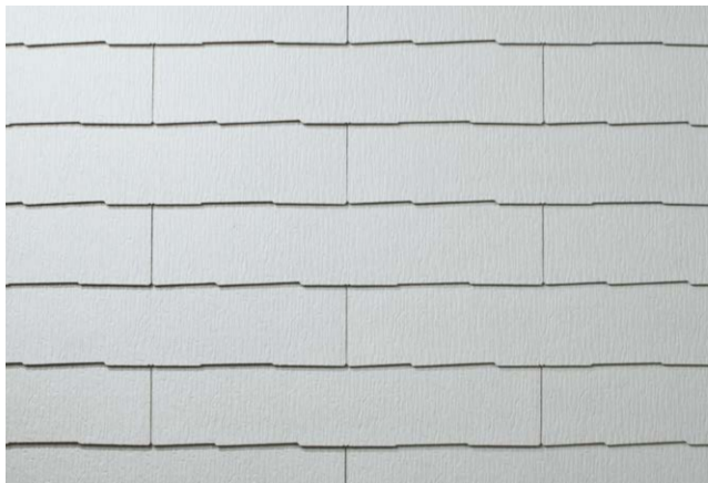
CC225K* シルバー・ホワイト (STK75KG)