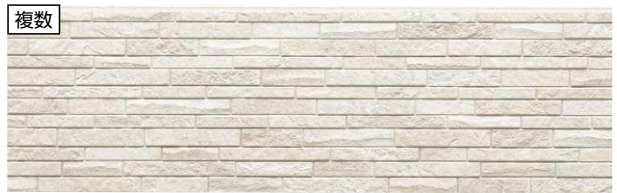
代表品番 EPB331 フォンドMGホワイト 品番 EPB331FK EPB331NK