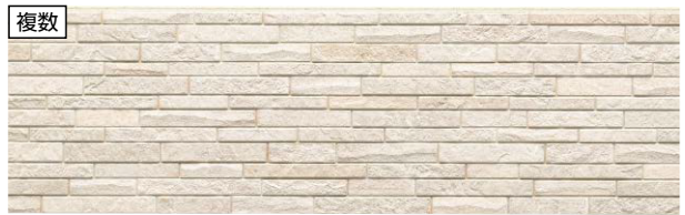
代表品番 EPB336 フォンドMGアイボリー 品番 EPB336FK EPB336NK