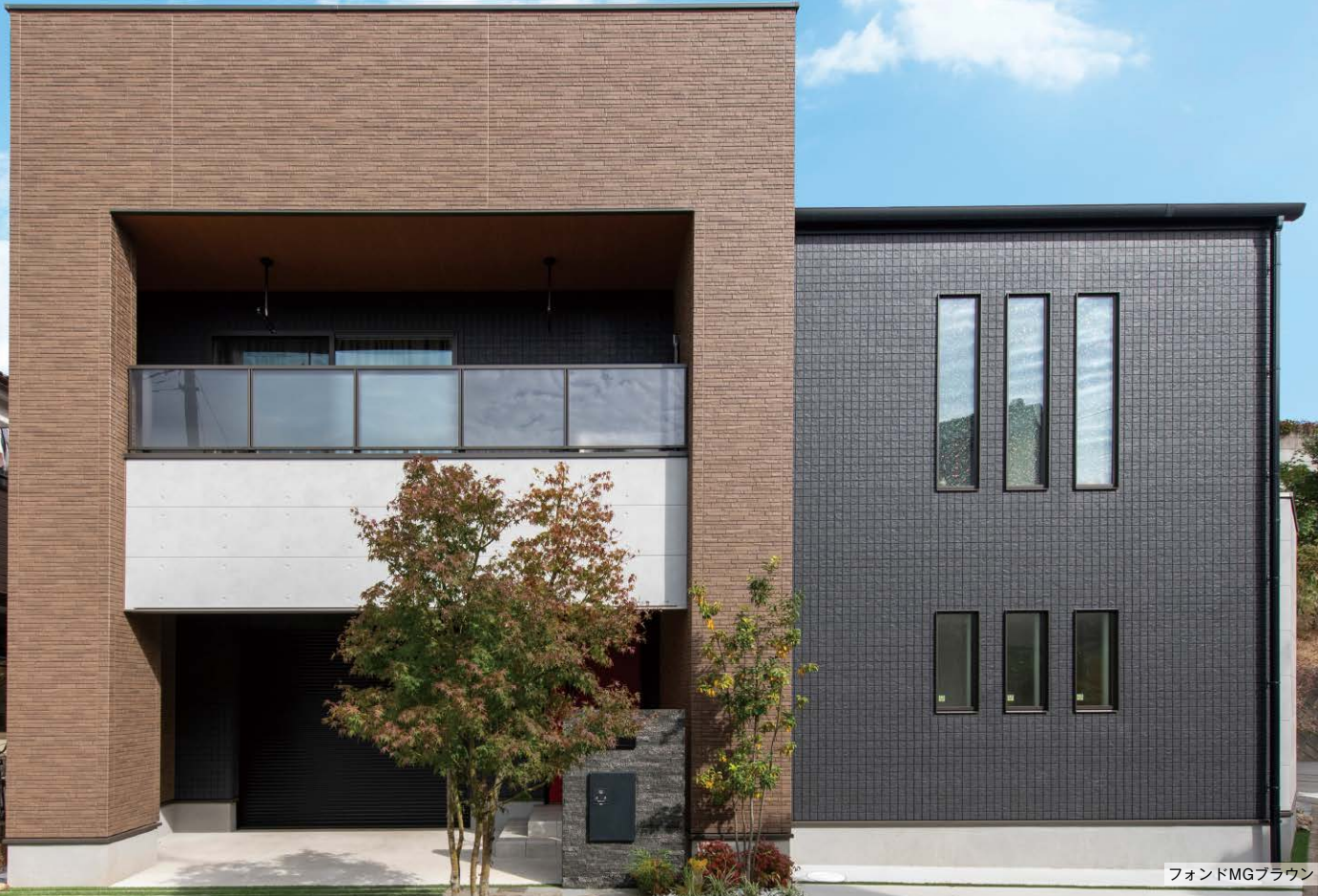
フォンドMGブラウン