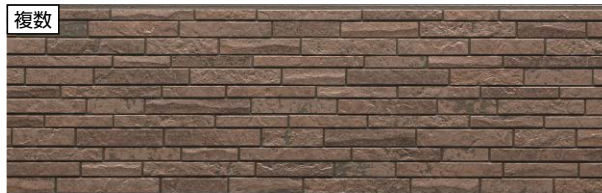
代表品番 EPB333 フォンドMGブラウン 品番 EPB333FK EPB333NK