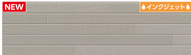
MFX7312C トスコMGアドシルバー ※B