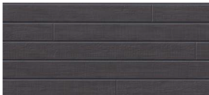
MFX739C トスコMGチャコール ※A