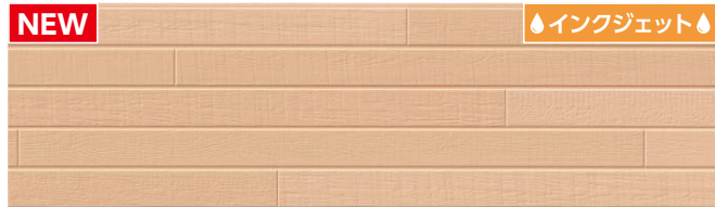
MFX7310C トスコMGアドシトラス ※B