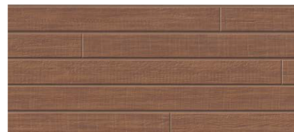
MFX737C トスコMGブラウン ※A