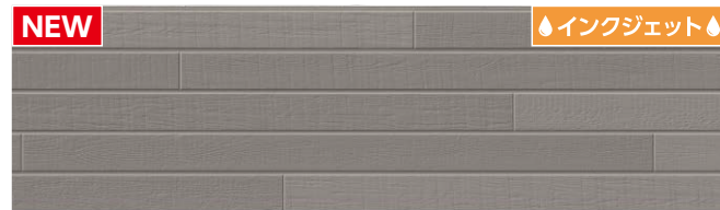
MFX7313C トスコMGアドグレー ※B