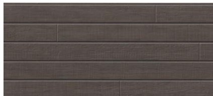
MFX738C トスコMGカーキ ※A