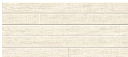
MFX731C トスコMGホワイト ※A