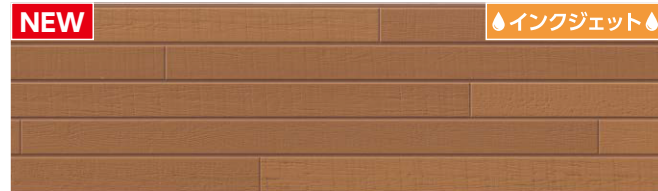
MFX7311C トスコMGアドブラウン ※C