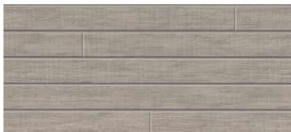
MFX735C トスコMGシルバー ※A