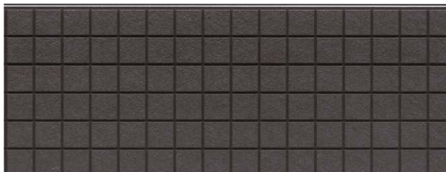
CL4553GC ALブレンドブラック