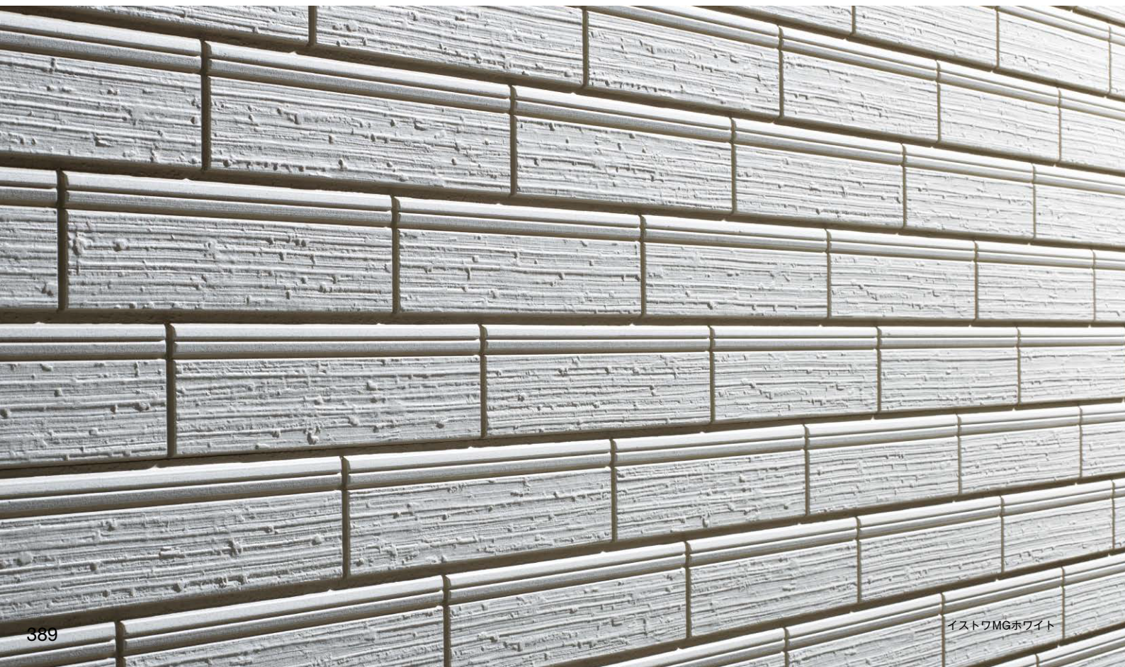
イストワMGホワイト