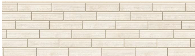
EPB291FK イストワMGホワイト