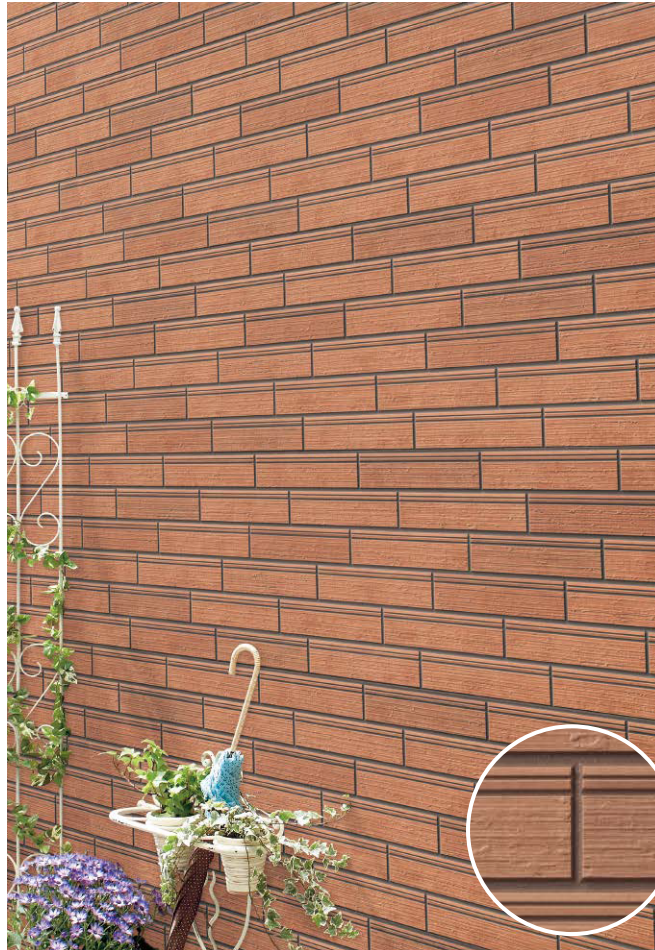
イストワMGテラコッタイメージ