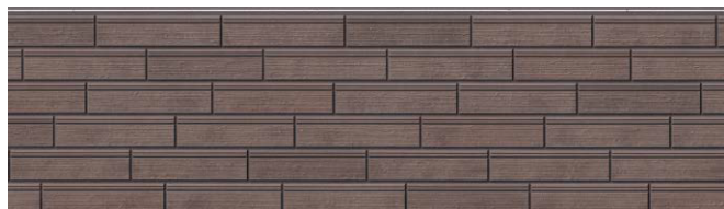
EPB295LK イストワMGエボニー