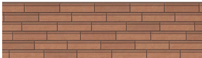
EPB293FK イストワMGテラコッタ