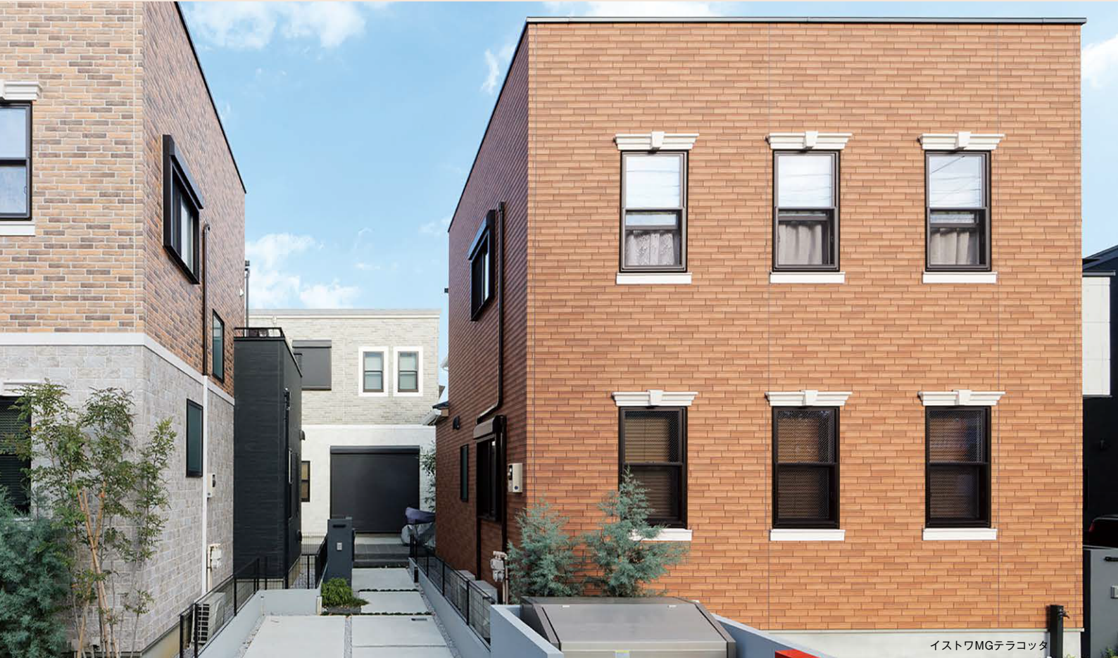
イストワMGテラコッタ