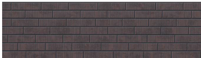
MF745C サティスMGブラウン