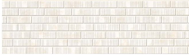
MF741C サティスMGホワイト