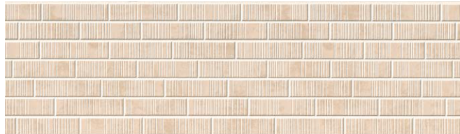
MF743C サティスMGアーモンド