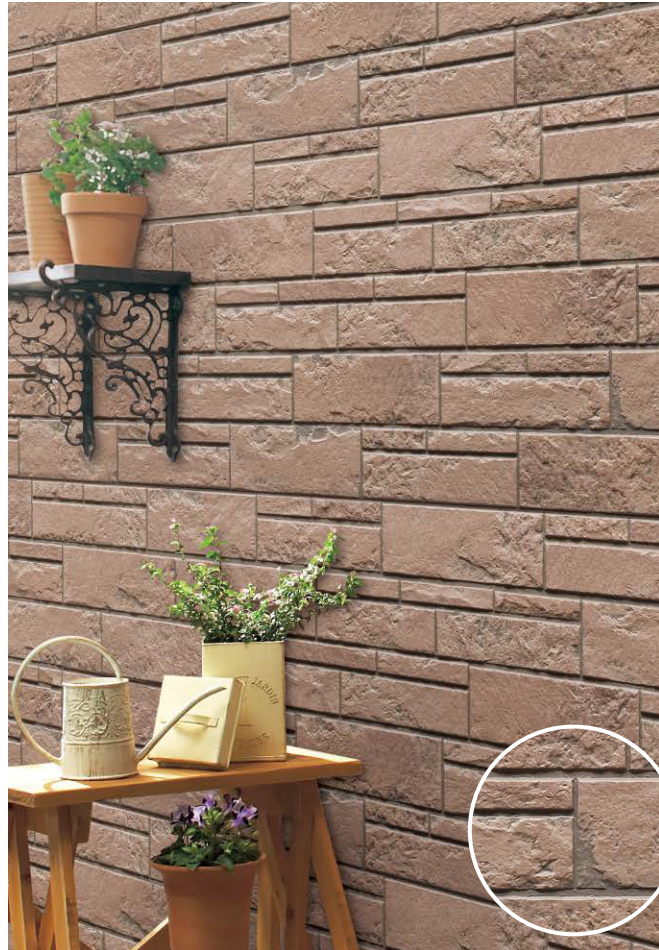
モデラMGブラウンイメージ