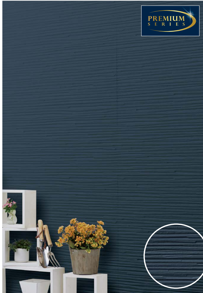
バグー MGネイビー30イメージ

代表品番 ELS155 バグー MGネイビー30 品番 ELS155Y ELS155P