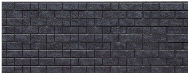
FH7133U QFミユリ チタン ブルー