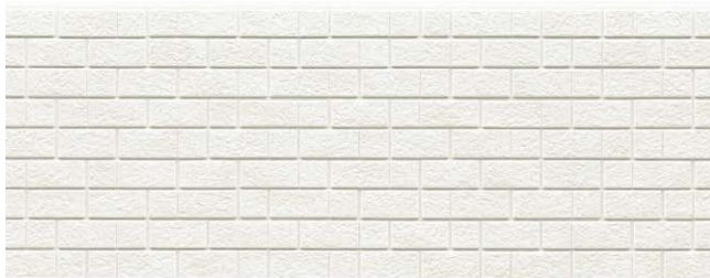
FH7131U QFミユリ チタン ホワイト